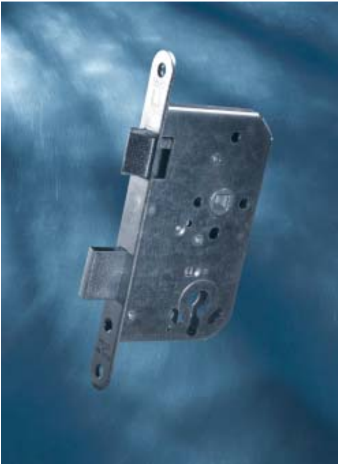
Fh-Einsteckschlösser für Feuerschutzabschlüsse bis T 120 nach DIN 18250 (Teil 1) und zertifiziert nach EN 179, Rechts und Links verschieden