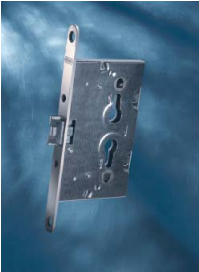
Spezial-Einsteckschloß, Rechts und Links verwendbar