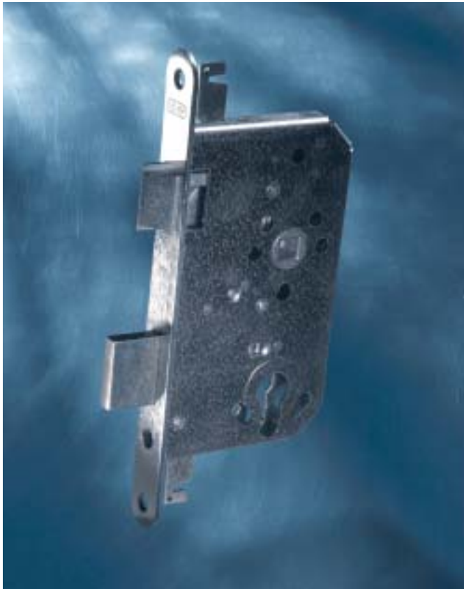
Hauptschloß – Art. 1749