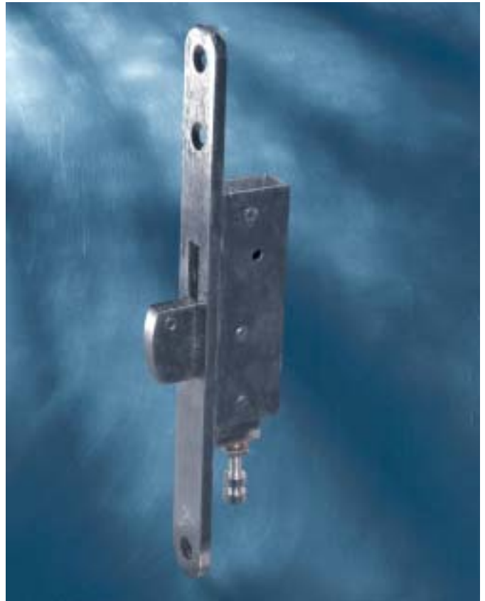
Schwenkriegelschloß (oben) – Art. 1742/09