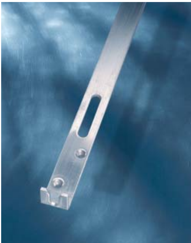
Stange – Art. 1742