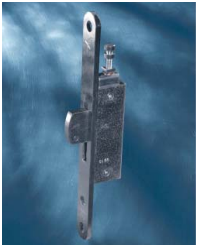
Schwenkriegelschloß (unten) – Art. 1742/09