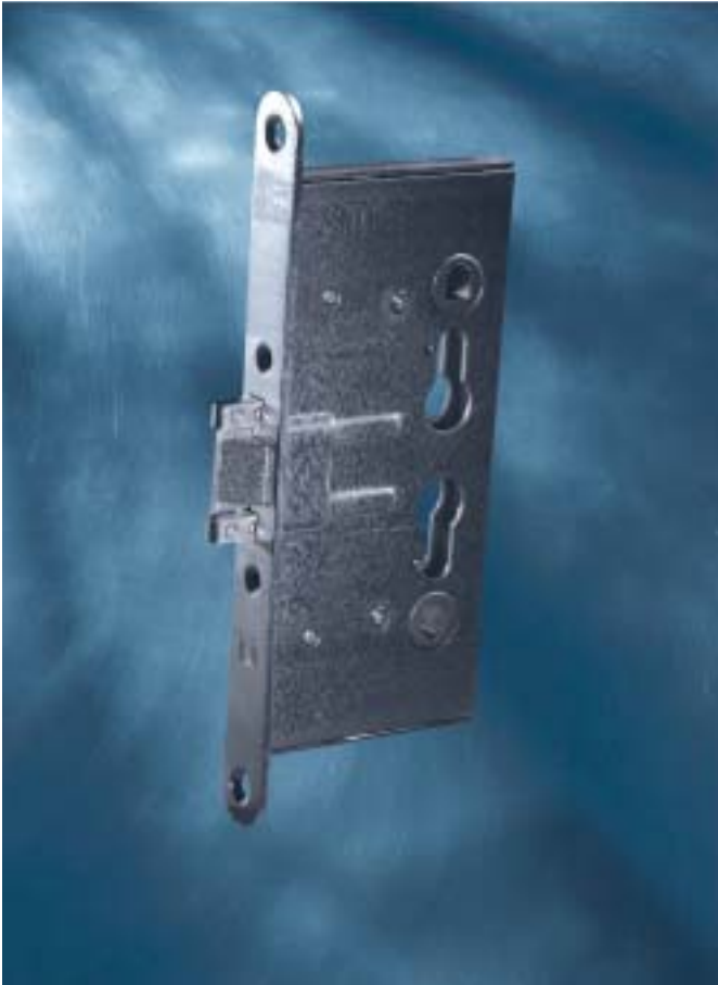
Fh-Einsteckschlösser, Rechts und Links verwendbar